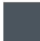
Gris 7016 B (Classe 1)