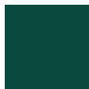
Vert 6005 B (Classe 1)