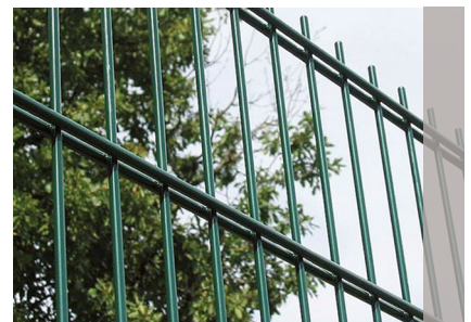
Clôture avec des panneaux KOLOSS® 868 Premium

Nous déclinons toute responsabilité si des pare-vues sont installés sur nos clôtures.