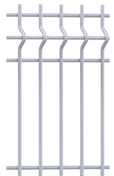
KOLOSS® 88 Premium