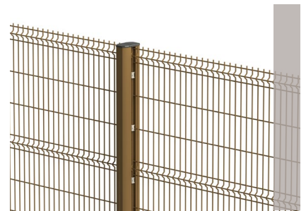
Clôture avec des panneaux KOLOSS® 88 Premium couleur : Grège

Nous déclinons toute responsabilité si des pare-vues sont installés sur nos clôtures.