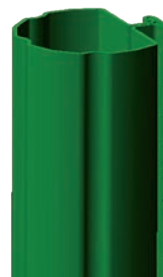
Profil du poteau Aquigraf® Ø50mm

Une vidéo détaille la pose sur notre chaîne youtube www.lippi.tv : il suffit de taper le mot-clé fixograf dans la barre de recherche de la chaîne.