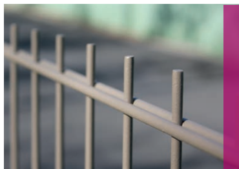
Clôture avec des panneaux - AQUILON® 656 Premium

Nous déclinons toute responsabilité si des pare-vues sont installés sur nos clôtures.