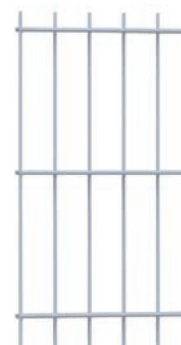
Panneau AQUILON® 656 Premium