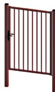
Portillon Practis® barreauté