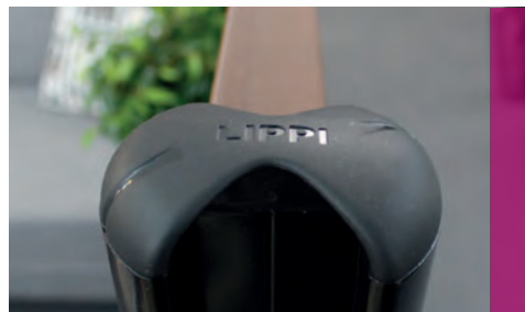
Bouchon du poteau AQUILON® 450 A

Les poteaux en aluminium sont conducteurs, ils peuvent donc être utilisés autour des sous-stations EDF ou SNCF. Et sécurisés avec des kits de mise qui permettent de relier la clôture à la terre, pour la sécurité des personnes.