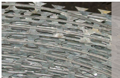
Ruban de Réseau défensif

Différents types de lames sont disponibles, nous consulter.