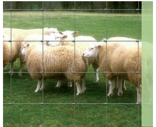
Grillage noué Pâturage pour les enclos à moutons