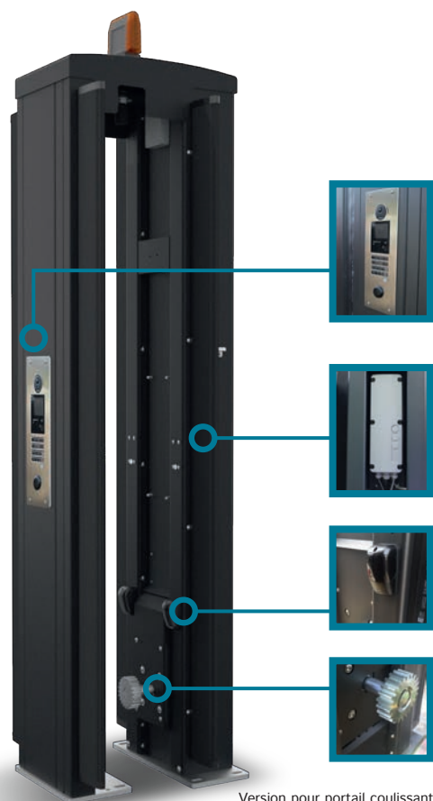
Version pour portail coulissant