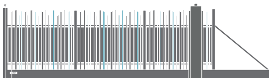
Coulissants et autoportants STEM® et STEM® WALL